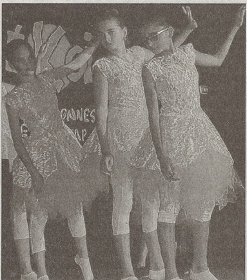
Les élèves d'AR'Danse ont fait le show.